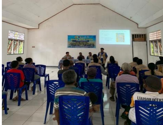
Gambar 3. Kegiatan sosialisasi

Setelah itu dijelaskan cara pengendalian lalat buah dengan menggunakan perangkap Metyl Eugenol .