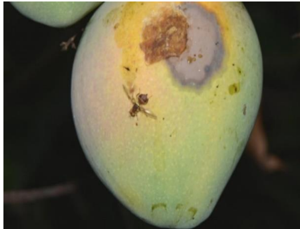
Gambar 1. Buah mangga yang diserang lalat buah

Kampung Wambena merupakan salah satu dari 8 kampung penghasil mangga golek yang berada di Distrik Depapre, Kabupaten Jayapura. Hal itu membuat buah mangga menjadi sumber penghasilan utama Masyarakat kampung Wambena, namun pada tahun 2011 hingga sekarang buah mangga yang belum matang sering jatuh atau berguguran dari pohonnya, sehingga menyebabkan buah mangga pada pohon semakin berkurang dan membuat masyarakat atau petani mengalami gagal panen dan hal itu menjadi masalah utama di kampung Wambena.