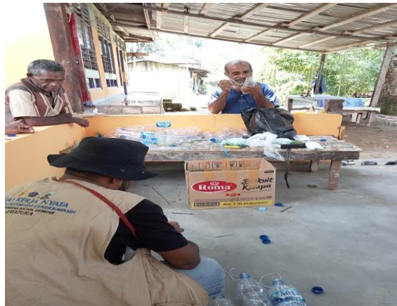
Gambar 4. Pelatihan pembuatan perangkap lalat buah