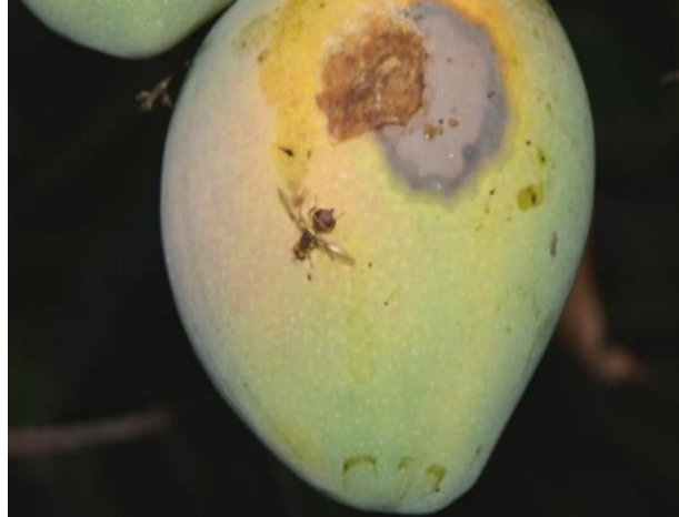
Gambar 1. Buah mangga yang diserang lalat buah

2011 hingga sekarang buah mangga yang belum matang sering jatuh atau berguguran dari pohonnya, sehingga menyebabkan buah mangga pada pohon semakin berkurang dan membuat masyarakat atau petani mengalami gagal panen dan hal itu menjadi masalah utama di kampung wambena.