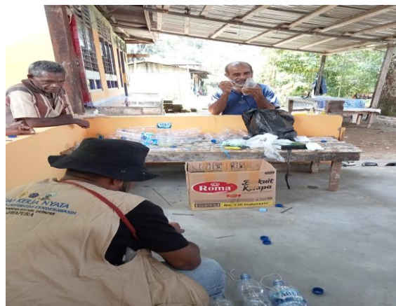
Gambar 4. Pelatihan pembuatan perangkap lalat buah