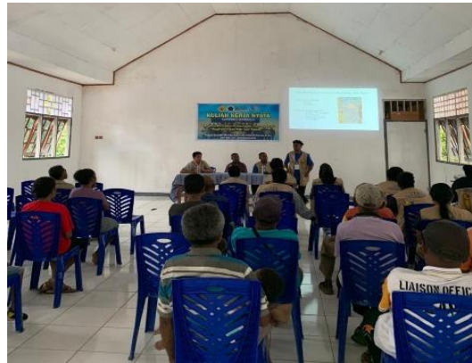
Gambar 3. Kegiatan sosialisasi