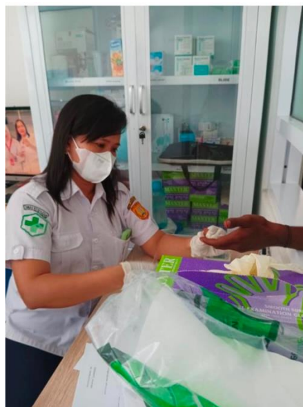
Gambar 2. Pemeriksaan Malaria di Laboratorium Puskesmas Abepura

Awal dari kegiatan ini penyuluh melakukan edukasi langsung dengan mendatangi pasien dan keluarganya yang sedang berobat di puskesmas Abepura. Kemudian penyuluh memperkenalkan diri dan menyampaikan maksud tujuan. Setelah itu, penyuluh melakukan edukasi tentang malaria yang berlangsung selama 5 sampai 10 menit, dan diselingi juga dengan tanya jawab bersama keluarga pasien. Bahasa sehari-hari yang mudah dipahami oleh pasien maupun keluarganya, digunakan sebagai bahasa edukasi. Selama melakukan edukasi, ada pertanyaan dan saran yang disampaikan oleh pasien dan keluarga.