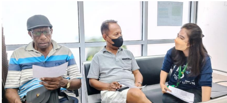
Gambar 3. Edukasi partisipasi kepada pengunjung Puskesmas Abepura

Akhir dari edukasi tersebut, yang digunakan sebagai evaluasi, penyuluh memberikan lembaran kuesioner yang berisi 5 pertanyaan yang diisi oleh masing-masing pasien dan keluarganya. Yang mengisi kuesioner adalah pasien yang masuk dalam kategori usia remaja sampai lansia menurut Kementerian Kesehatan. Dari hasil pengisian kuesioner tersebut dapat dilihat bahwa ada pemahaman yang diterima oleh pasien maupun keluarganya. Jumlah kuesioner yang dibagikan adalah 100 lembar. Hasil dari pengisian kuesioner adalah pasien dan keluarganya memahami edukasi pencegahan, pemeriksaan, dan pengobatan malaria yang telah disampaikan oleh penyuluh.