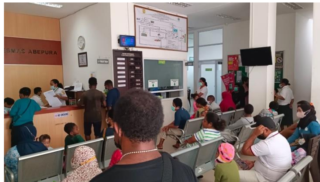
Gambar 1. Suasana Puskesmas Abepura

Pada awal pengabdian masyarakat dilakukan dengan pengurusan surat ijin ke Dinas Kesehatan Kota Jayapura. Setelah surat ijin dikeluarkan oleh Dinas Kesehatan Kota Jayapura, surat tersebut diberikan ke Puskesmas Abepura. Kegiatan ini dilakukan pada tanggal 26 Agustus 2023, mulai pukul 08. pagi hingga pukul 17.00 sore. Karena metode yang digunakan dalam kegiatan ini ada edukasi dengan pendekatan partisipasi, maka seluruh pasien dan keluarga pasien yang datang pada saat itu ada sasarannya.