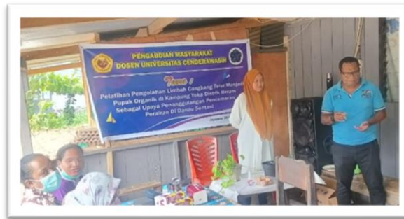
Gambar 5. Penyampaian Materi ke-1