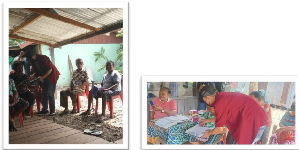
Gambar 8. Melakukan pengisian pre test dan post test kepada peserta pelatihan

Metode evaluasi pada kegiatan ini dilakukan dengan cara pemberian kuesioner sebelum dan sesudah pelatihan. Peserta menjawab kuesioner tersebut “Ya” atau “Tidak” yang bertujuan untuk mengetahui tingkat pemahaman masyarakat Kampung Yoka terhadap pemanfaatan cangkang telur sebagai pupuk organik sebelum dan setelah pelatihan. Gambar 9 memperlihatkan bahwa kegiatan ini memberikan dampak positif terhadap masyarakat Kampung Yoka. Hal ini didukung selisih hasil evaluasi pre test dan post test yang cukup besar pada tiap butir soal yang ditanyakan.