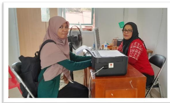
Gambar 1. Pertemuan dengan Kepala Tata Usaha Puskesmas Yoka

Pelatihan pengolahan limbah cangkang telur menjadi pupuk organik di Kampung Yoka Distrik Heram Sebagai Upaya Penanggulangan Pencemaran Perairan Di danau Sentani yang telah dilaksanakan pada tanggal 28 Oktober 2023. Secara keseluruhan kegiatan ini dilaksanakan kurang lebih 6 bulan mulai dari Tahap Persiapan, Tahap Pelaksanaan, Tahap Pelaporan. Awal tahapan kegiatan adalah dengan melaksanakan survey lokasi pengabdian, bernegosiasi serta melakukan diskusi dan berkoordinasi bersama kepala tata usaha puskesmas Kampung Yoka yang berlangsung pada bulan Agustus 2023. Melalui proses ini disepakati terkait metode, dan jadwal pelaksanaan kegiatan. Metode metode ceramah, diskusi, tanya jawab dan metode praktik dinilai baik dalam meningkatkan pemahaman masyarakat Kampung Yoka dalam mengolah limbah cangkang telur menjadi pupuk organik sebagai upaya penanggulangan pencemaran perairan di Danau Sentani.