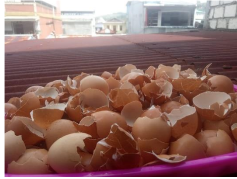
Gambar 3. Cangkang telur telah dibersihkan dan dalam proses pengeringan di bawah sinar matahari

Persiapan alat dan bahan lainnya untuk kebutuhan pelaksanaan kegiatan, seperti blender, wadah, pot bunga, cuka, air bersih, tanah untuk menanam, contoh tanaman.