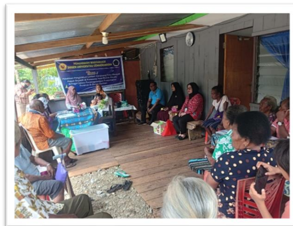
Gambar 7. Mendampingi peserta pelatihan dalam pengolahan limbah cangkang telur menjadi pupuk organik

Evaluasi dilakukan dengan 2 tahap yaitu dalam bentuk pre test dan post tes , untuk mengetahui pengetahuan peserta dalam Pengolahan Limbah Cangkang Telur Menjadi Pupuk Organik. Tingkat keberhasilan program ini dikukur melalui hasil evaluasi yang diedarkan untuk peserta guna menentukan ketercapaian tujuan dan menjaring balikan peserta.