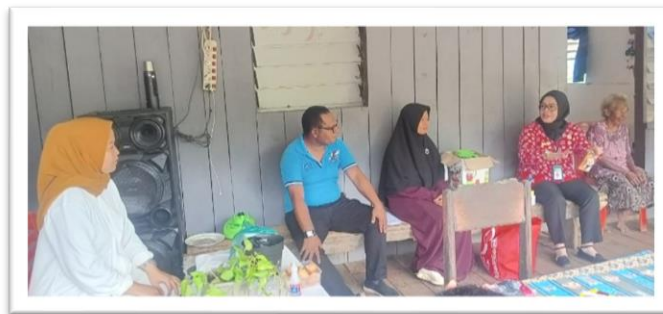
Gambar 4. Pembukaan Pelatihan Pengolahan Limbah Cangkang Telur Menjadi Pupuk Organik Sebagai Upaya Penanggulangan Pencemaran Perairan Di danau Sentani yang di hadiri oleh Kepala Tata Usaha Puskesmas Yoka, Pemateri dan Pendamping Pelatihan

Pada proses praktik pelatihan, peserta didampingi oleh pemateri dan tim pelatihan.