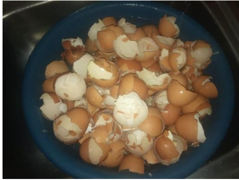
Gambar 2. Cangkang telur sebelum dibersihkan