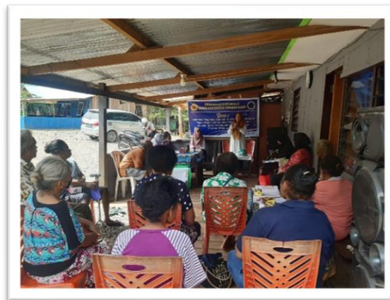
Gambar 6. Penyampaian Materi ke-2