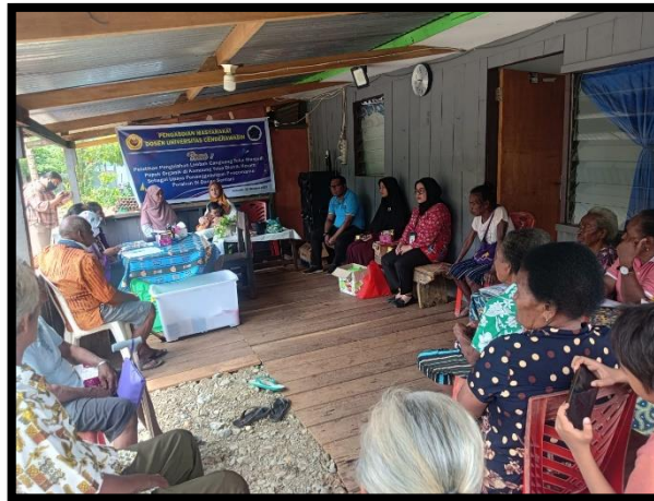
Gambar 7. Mendampingi peserta pelatihan dalam pengolahan limbah cangkang telur menjadi pupuk organik

Evaluasi dilakukan dengan 2 tahap yaitu dalam bentuk pre test dan post tes , untuk mengetahui pengetahuan peserta dalam Pengolahan Limbah Cangkang Telur Menjadi Pupuk Organik. Tingkat keberhasilan program ini dikukur melalui hasil evaluasi yang diedarkan untuk peserta guna menentukan ketercapaian tujuan dan menjaring balikan peserta.