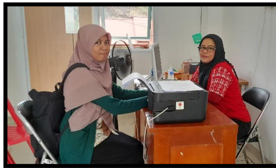
Gambar 1. Pertemuan dengan Kepala Tata Usaha Puskesmas Yoka

Pelatihan pengolahan limbah cangkang telur menjadi pupuk organik di Kampung Yoka Distrik Heram Sebagai Upaya Penanggulangan Pencemaran Perairan Di danau Sentani yang telah dilaksanakan pada tanggal 28 Oktober 2023. Secara keseluruhan kegiatan ini dilaksanakan kurang lebih 6 bulan mulai dari Tahap Persiapan, Tahap Pelaksanaan, Tahap Pelaporan. Awal tahapan kegiatan adalah dengan melaksanakan survey lokasi pengabdian, bernegosiasi serta melakukan diskusi dan berkoordinasi bersama kepala tata usaha puskesmas Kampung Yoka yang berlangsung pada bulan Agustus 2023. Melalui proses ini disepakati terkait metode, dan jadwal pelaksanaan kegiatan. Metode metode ceramah, diskusi, tanya jawab dan metode praktik dinilai baik dalam meningkatkan pemahaman masyarakat Kampung Yoka dalam mengolah limbah cangkang telur menjadi pupuk organik sebagai upaya penanggulangan pencemaran perairan di Danau Sentani.