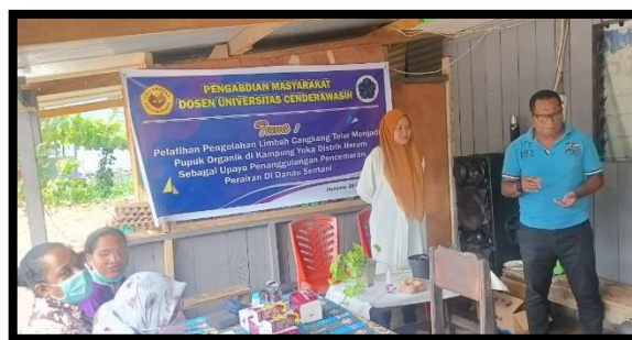
Gambar 5. Penyampaian Materi ke-1