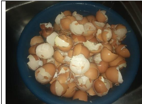
Gambar 2. Cangkang telur sebelum dibersihkan