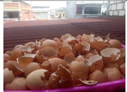
Gambar 3. Cangkang telur telah dibersihkan dan dalam proses pengeringan di bawah sinar matahari

Persiapan alat dan bahan lainnya untuk kebutuhan pelaksanaan kegiatan, seperti blender, wadah, pot bunga, cuka, air bersih, tanah untuk menanam, contoh tanaman.