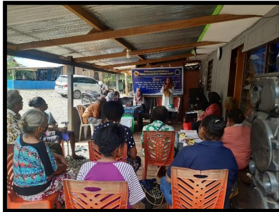
Gambar 6. Penyampaian Materi ke-2