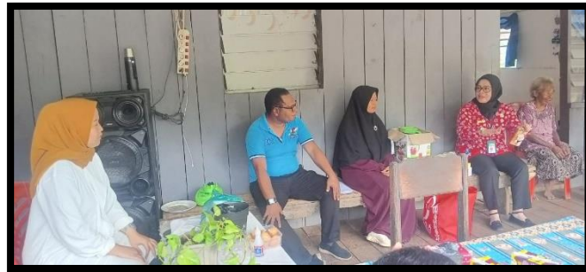
Gambar 4. Pembukaan Pelatihan Pengolahan Limbah Cangkang Telur Menjadi Pupuk Organik Sebagai Upaya Penanggulangan Pencemaran Perairan Di danau Sentani yang di hadiri oleh Kepala Tata Usaha Puskesmas Yoka, Pemateri dan Pendamping Pelatihan