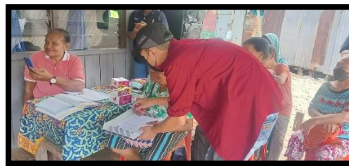
Gambar 8. Melakukan pengisian pre test dan post test kepada peserta pelatihan