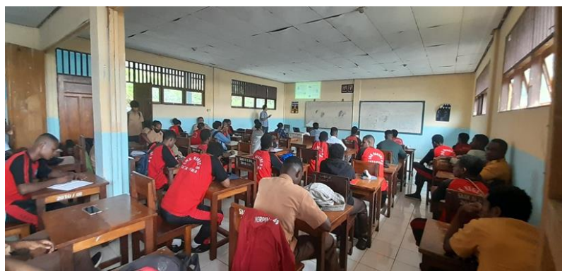
Gambar 4. Pemaparan materi panduan saat menghadapi Gempa