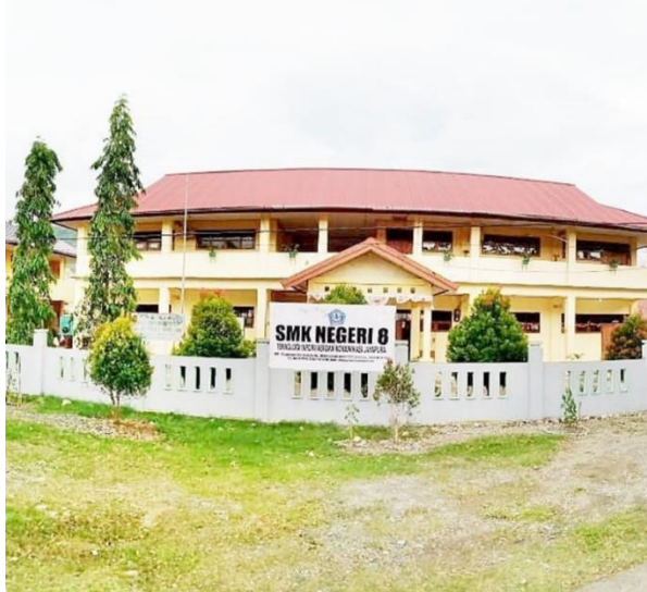
Gambar 1. Sekolah SMK 8 TIK Waena, Jayapura

Kegiatan pengabdian berlangsung di SMKN 8 TIK Waena, Jayapura dalam bentuk sosialisasi. Sekolah SMKN 8 TIK Waena Jayapura ditunjukkan pada gambar 4.1.