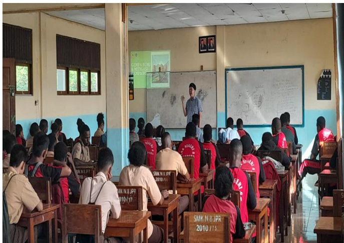
Gambar 2. Pembukaan kegiatan sosialisasi dengan judul potensi gempa di Papua dan mitigasi bencana.

Pembukaan berupa salam dan pengenalan diri kepada siswa-siswi serta penyampaian topik dan tujuan dari kegiatan pengabdian ini. Pembukaan dilakukan dengan durasi 10 menit.