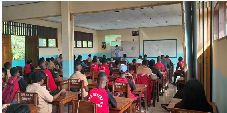
Gambar 3. Pemaparan materi potensi gempa di Papua

Kegiatan selanjutnya adalah pemaparan materi mengenai potensi gempa di Papua dan mitigasi bencana. Materi-materi yang disampaikan terdiri dari pengertian gempa, penyebab gempa bumi, dampak gempa bumi, dan panduan saat menghadapi gempa. Pemaparan materi ini berlangsung selama 60 menit. Siswa-siswa tampak antusias mengikuti sosialisasi ini. Pada saat pemaparan materi berlangsung, ada salah satu siswa menyampaikan apresiasinya terhadap materi ini dikarenakan mereka belum pernah mendapatkan materi ini.