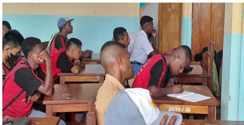
Gambar 5. Antusiasme siswa-siswi selama pemaparan materi