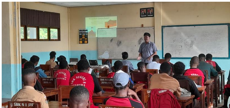
Gambar 7. Evaluasi terkait materi yang telah dipaparkan

Selanjutnya dilakukan evaluasi terhadap siswa-siswi terkait materi yang dipaparkan. Evaluasi ini berupa tanya jawab lisan sebanyak 10 pertanyaan. Seluruh pertanyaan yang dilontarkan dapat dijawab dengan baik oleh siswa-siswi. Hal ini menunjukkan bahwa siswa-siswi telah memahami potensi gempa bumi di Papua dan mitigasi bencana.